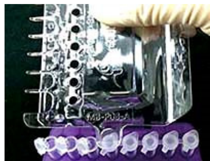
③ 0.2mlシングルPCRチューブ、8連キャップ 独立PCRチューブが開けられます。