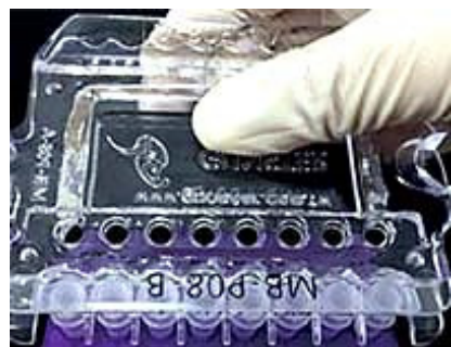
① 0.1・0.2ml 8連PCRチューブ (ドームトップ) が開けられます

商品名:6way チューブオープナー 品番:MB-OPENER ブランド:GUNSTER 希望販売価格:3,500円 単位1個(1×1pk)