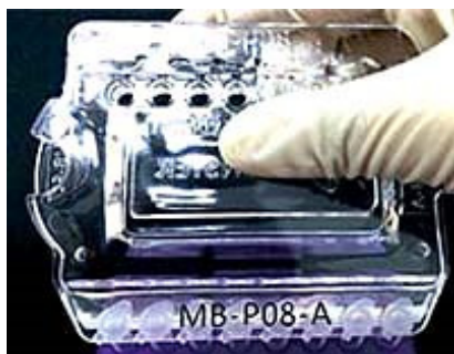
② 0.1・0.2ml 8連PCRチューブ (フラットトップ) が開けられます。