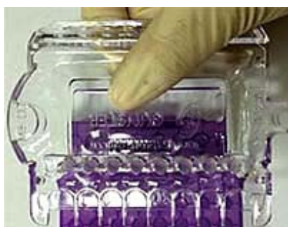
⑤ 0.1・0.2ml 8連PCRチューブ(ドーム・ フラットトップ)を閉められます。 ※手で開めた後にご使用ください