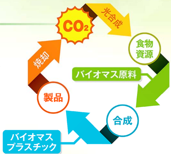
バイオマスNボトル

100%バイオマスプラスチックで製造された場合、CO 2 の排出をを約70%抑制する事が出来ます。